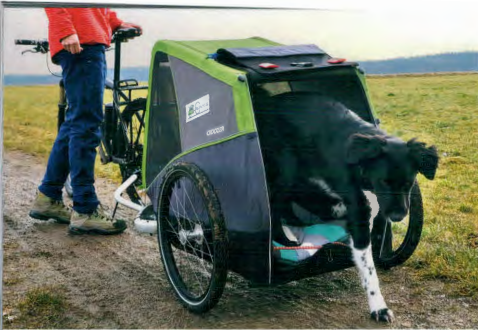
Das Ein- und Aussteigen hat Katrin Eichhoff mit Napoli zu Hause lange geübt.