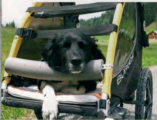
Zufriedener Hund im vom Frauchen umgebauten Hänger.