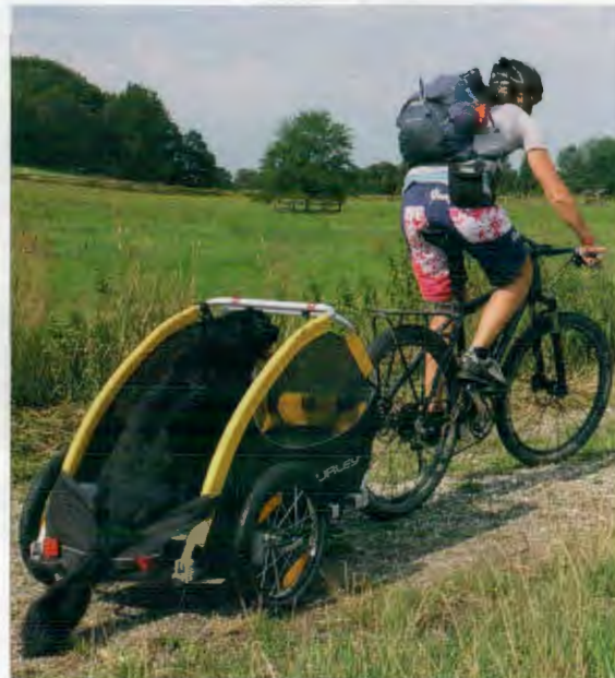
Wenn der Hund ausgepowert ist, genießt er im Trailer die Biketour.

Gut erreichbare Feststellbremse: Die Bremse am Hänger verhindert, dass das Rad umfällt, wenn es einen Ruck gibt, weil